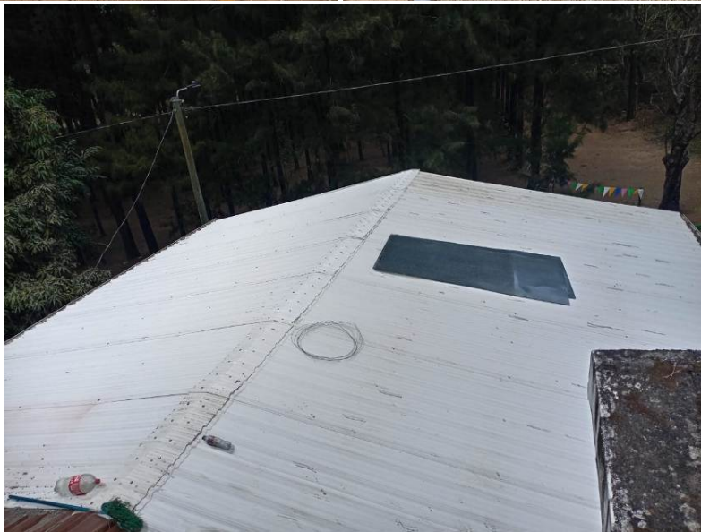
Foto 20-22: Actividades y mantenimiento realizado en el mes de marzo.