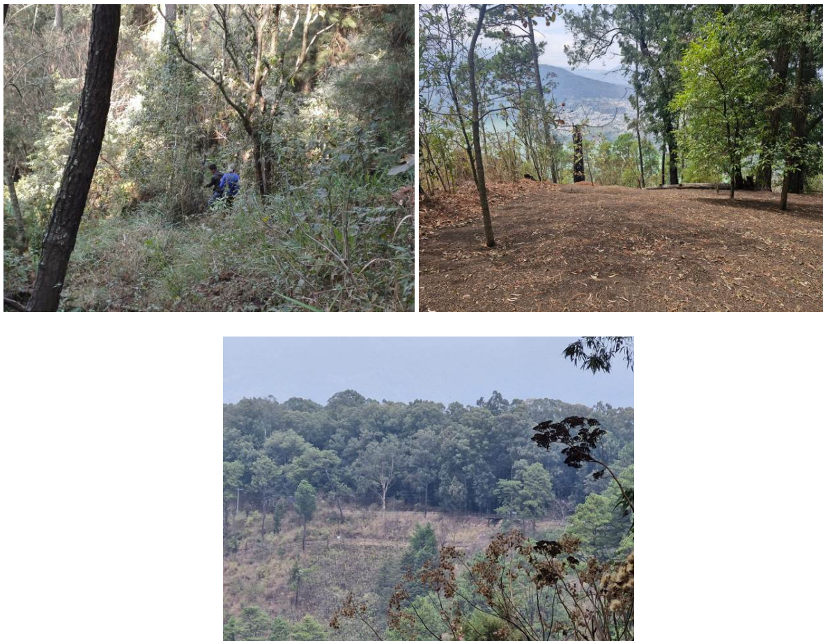
Foto 1-3: Trabajos de mantenimiento del sistema de brechas cortafuegos.

Se han incluido dentro del plan de control y vigilancia el monitoreo semanal con dron lo cual nos ayudará a realizar observaciones de ilícitos de manera indirecta sin exponer al personal guardarecursos en campo.