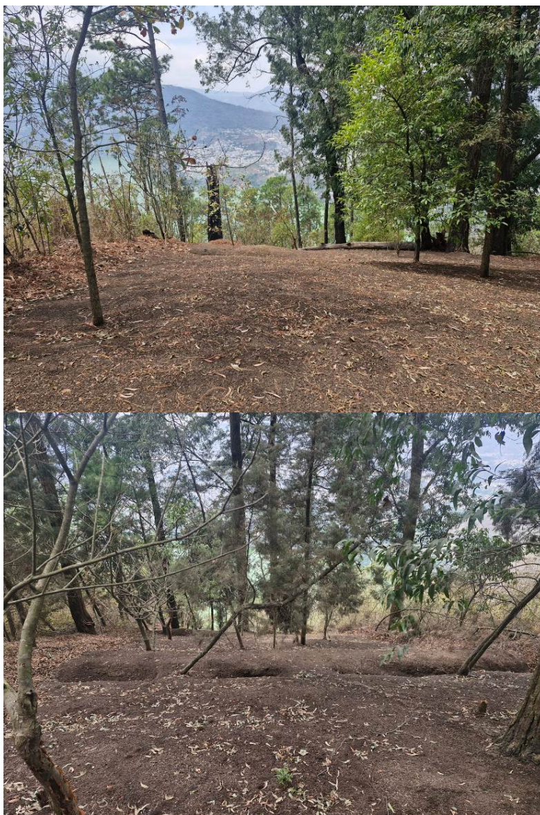
Foto 16-17: Estado actual de acequias en reduciendo erosión en brechas cortafuego