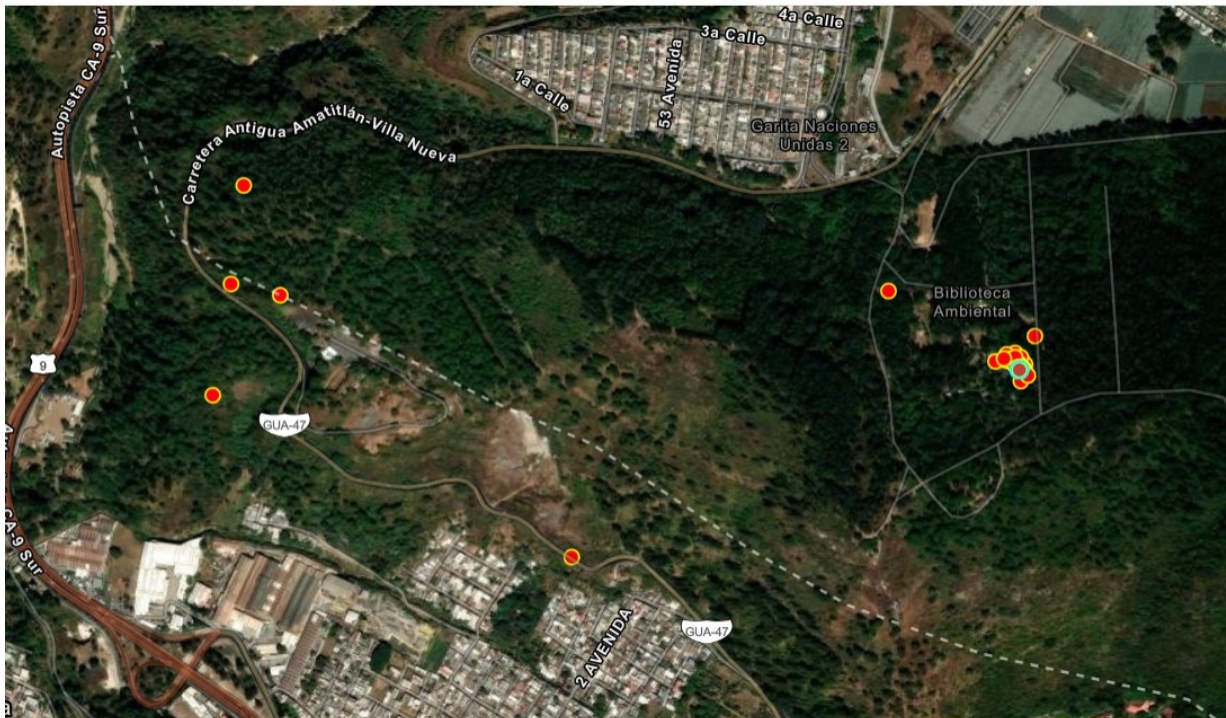
Mapa 1: Ilícitos detectados durante marzo.

Durante marzo se apoyó con el combate en el incendio en el vertedero de AMSA, el cuál se extendió a la zona de protección del área protegida, con alto potencial a subir la ladera hacia un bosque de pino encino de alto valor.