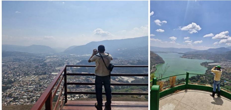
Foto 18 y 19: Personal de vigilancia para prevención de incendios forestales las 24 horas del día.

Activamos nuestro sistema de vigilancia contra incendios. Actualmente el personal de seguridad realiza patrullajes de rutina en los cuales verifica la ausencia de cualquier situación de riesgo desde los 3 miradores del parque.